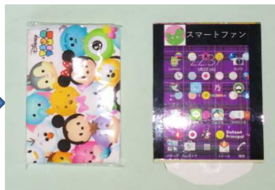
折りたたみ完成(表裏)